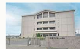
■ 前橋立第六中学校 徒歩約7～8分 (約560～620m)