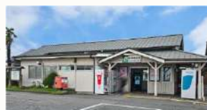
■ JR群馬総社駅 徒歩約7分 (約560m)