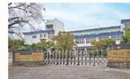
■ 前橋立勝山小学校 徒歩約10～11分 (約760～820m)