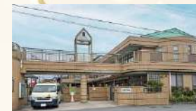
■ 認定こども園 あおぞら総社 徒歩約7～8分 (約540～600m)