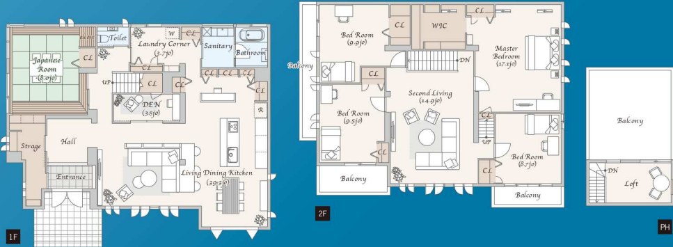
※間取り図の家具配置はイメージです。家具調度類は価格に含まれません。