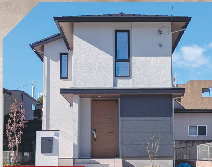
1号地 / 外観