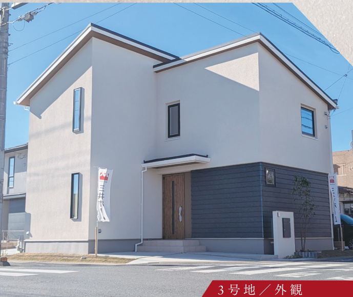
3号地 / 外観