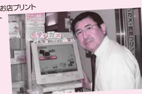
県庁生協写真部 あざみカメラ(内線 4812)

“一瞬の輝きをパチリ”写真を撮ったらお店プリント 店頭デジタルプリンターで即プリント 組合員価格でL判35円 (USBメモリーからのプリント不可) お気に入りの写真は大きく伸ばして飾ってみませんか フィルムご利用の方も現像OK!! (翌日仕上)