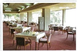
レストラン(コンペルーム有)

併設のマイナスイオンのミストサウナは、男女問わず好評です。 健康増進、アンチエイジング効果が期待できます。