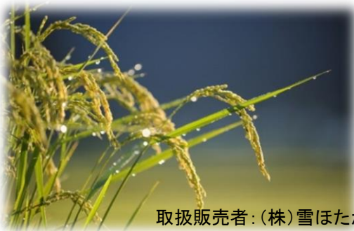
取扱販売者：(株)雪ほたか