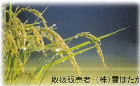
取扱販売者：(株)雪ほたか