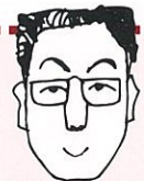
ジーエスエス 浅沼